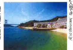
瀬戸大橋と海を一望

海と瀬戸大橋を一望 岡山県倉敷市の「下電ホテル」は、海と瀬戸大橋を一望できる。下電ホテルは、海と瀬戸大橋を一望できる。下電ホテルは、海と瀬戸大橋を一望できる。下電ホテルは、海と瀬戸大橋を一望できる。下電ホテルは、海と瀬戸大橋を一望できる。