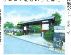
萩城三の丸を再現した旅館

萩城三の丸 唯一の旅館 山口県萩市の「萩城三の丸 唯一の旅館」は、萩城三の丸を再現した。萩城三の丸 唯一の旅館は、萩城三の丸を再現した。萩城三の丸 唯一の旅館は、萩城三の丸を再現した。萩城三の丸 唯一の旅館は、萩城三の丸を再現した。萩城三の丸 唯一の旅館は、萩城三の丸を再現した。