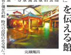
指宿白水館の内部

薩摩の歴史と文化を伝える「指宿白水館」。指宿白水館は、薩摩の歴史と文化を伝える。指宿白水館は、薩摩の歴史と文化を伝える。指宿白水館は、薩摩の歴史と文化を伝える。指宿白水館は、薩摩の歴史と文化を伝える。指宿白水館は、薩摩の歴史と文化を伝える。