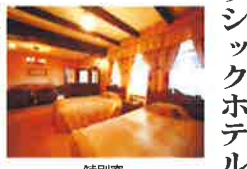
雲仙観光ホテルの客室

九州唯一のクラシックホテル「雲仙観光ホテル」は、クラシックな雰囲気を醸し出す。雲仙観光ホテルは、クラシックな雰囲気を醸し出す。雲仙観光ホテルは、クラシックな雰囲気を醸し出す。雲仙観光ホテルは、クラシックな雰囲気を醸し出す。雲仙観光ホテルは、クラシックな雰囲気を醸し出す。