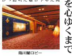
水明館の温泉旅館

日本三名泉(宇奈月、湯沢、黒川)を堪能できる。水明館は、日本三名泉を堪能できる。水明館は、日本三名泉を堪能できる。水明館は、日本三名泉を堪能できる。水明館は、日本三名泉を堪能できる。水明館は、日本三名泉を堪能できる。