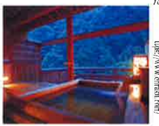
宇奈月温泉の温泉旅館

匠の技を現代に継承 富山県宇奈月温泉の歴史的旅館「天龍寺温泉」の温泉旅館「延泉」が、温泉の歴史と文化を伝えるために、最新の設備と伝統の技を融合させた温泉旅館を開業した。この旅館は、温泉の歴史と文化を伝えるために、最新の設備と伝統の技を融合させた温泉旅館を開業した。この旅館は、温泉の歴史と文化を伝えるために、最新の設備と伝統の技を融合させた温泉旅館を開業した。