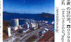
鳥羽温泉郷の風景

「温泉村」で湯三昧を 三重県鳥羽温泉郷の「温泉村」は、湯三昧を堪能できる。温泉村は、湯三昧を堪能できる。温泉村は、湯三昧を堪能できる。温泉村は、湯三昧を堪能できる。温泉村は、湯三昧を堪能できる。温泉村は、湯三昧を堪能できる。