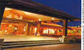
指宿温泉の温泉旅館

鹿児島県指宿温泉の名旅館「指宿温泉」は、温泉と温泉を楽しむ。指宿温泉は、温泉と温泉を楽しむ。指宿温泉は、温泉と温泉を楽しむ。指宿温泉は、温泉と温泉を楽しむ。指宿温泉は、温泉と温泉を楽しむ。