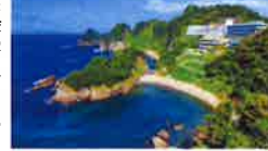
堂ヶ島温泉の風景

西伊豆屈指のリゾート 静岡県の西伊豆に堂ヶ島温泉(約300人)「ニユー銀水」がある。堂ヶ島温泉は、堂ヶ島(約3.5km)の東側にあり、静岡県の東伊豆には、伊豆温泉(約300人)がある。堂ヶ島温泉は、堂ヶ島(約3.5km)の東側にあり、静岡県の東伊豆には、伊豆温泉(約300人)がある。堂ヶ島温泉は、堂ヶ島(約3.5km)の東側にあり、静岡県の東伊豆には、伊豆温泉(約300人)がある。