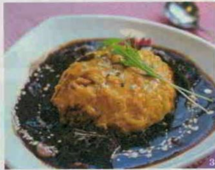
1. 赤い屋根と丸太の骨組みが印象的な「雲仙観光ホテル」 2. 赤を基調としたオリエンタルルーム 3. 「グリーンテラス雲仙」の雲仙ハヤシ980円 4. 「遠江屋本舗」の手焼き湯せんべいは10枚650円

雲仙は昭和を感じさせるレトロな雰囲気と、ノスタルジックな洋の趣が混在した温泉街。硫黄の臭いと湯けむりを感じながら町歩きを。雲仙が町をあげて取り組む新グルメは、いつもの店が趣向を凝らして提供するハヤシライス。好みの味を見つきたい。