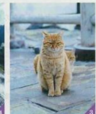
3. 雲仙地獄には、蒸気によって温められた地面でまどろむ猫がいっぱい 4. 硫黄の臭いともにもうとう立ち上る湯けむりに圧倒される

緩やかに流れる時間の中で 極上の温泉に癒される 明治時代から国産的なリゾート地として栄えた雲仙は、多くの外国人が訪れた場所。なかでも雲仙観光ホテルは、客室にイギリスのデザイナー、ウィリアム・モリスの壁紙を使用するなど、ノスタルジックな雰囲気が漂っている。そこだけゆっくり時間が流れているかのような空間に、身も心も委ねよう。 噴気と温泉がもうとうと湧き出る「雲仙地獄」を散策したり、産つて地熱の温かさや噴気を体感できる休憩所「雲仙地獄足蒸し」でひと休みを、でき