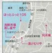
1.「ほっとふっと105」は長さ105m 2.「湯けむりや」の湯けむりに見立てたわたり敷きソフト320円 3.「海鮮市場 蒸し釜や」で蒸し釜体験。車エビ1匹500円など 4.海を望む高台にある「刈水庵」

☎0957-74-2010 長崎県雲仙市小浜町北本町1011 券10:00〜17:00 水定休 予約可 カード可 アクセス/小浜バス停下車徒歩7分