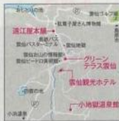
1. 赤い屋根と丸太の骨組みが印象的な「雲仙観光ホテル」 2. 赤を基調としたオリエンタルルーム 3. 「グリーンテラス雲仙」の雲仙ハヤシ980円 4. 「遠江屋本舗」の手焼き湯せんべいは10枚650円

☎0957-73-2155 長崎県雲仙市小浜町雲仙317 券8:30〜22:00 不定休 カード不可 アクセス/雲仙バス停下車徒歩2分