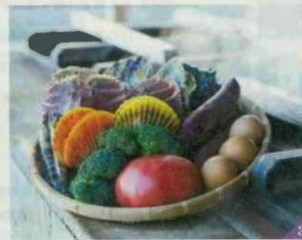
1. 「ほっとふっと105」は長さ105m 2. 「湯けむりや」の湯けむりに見立てたわた菓子付きソフト320円 3. 「海鮮市場 蒸し釜や」で蒸し釜体験。車エビ1匹500円など 4. 海を望む高台にある「刈水庵」

穏やかな橋湾沿いにある小浜温泉。にぎやかな大通りから1歩入ると、古い石垣が残る静かな住宅街が広がる。古民家を利用したカフェ「刈水庵」に立ち寄りながら散策しよう。温泉の蒸気で調理する蒸し釜が名物で、新鮮な魚介や野菜の凝縮したうまみを味わえる。